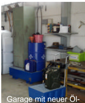
Garage mit neuer Öl- und Diesel-Station

Gefahrstoffschränken, Einrichtung von neuen Tankstationen etc. Der Aufwand hat sich gelohnt, denn am Ende des Audit freuten sich Auditor und Auditerte über die bestandene Prüfung. Bleibt zu hoffen, daß weitere Vereine dem Beispiel folgen werden.