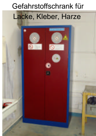
Gefahrstoffschränk für Lacke, Kleber, Harze